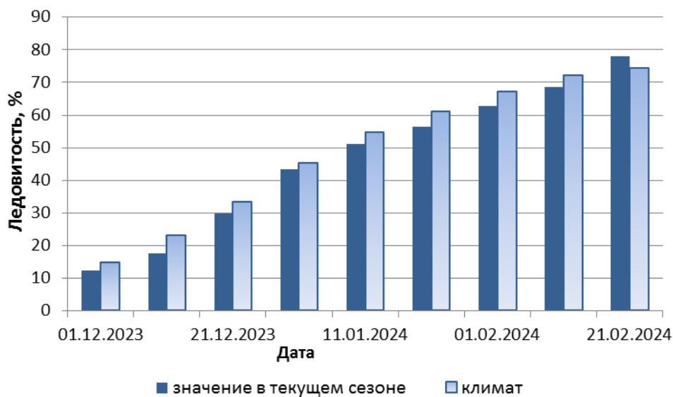
Рис. 6-2 Ледовитость Охотского моря по декадам с декабря 2023 г. по февраль 2024 г. Климатические значения ледовитости получены за период 1971–2000 гг.